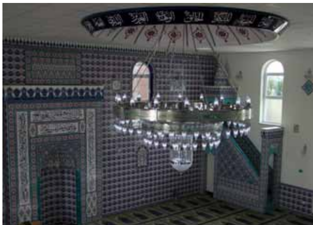
Gebetsraum der islamischen Gemeinde Thanhausen

Dienstag 03. Oktober verschiedene Angebotsstandorte