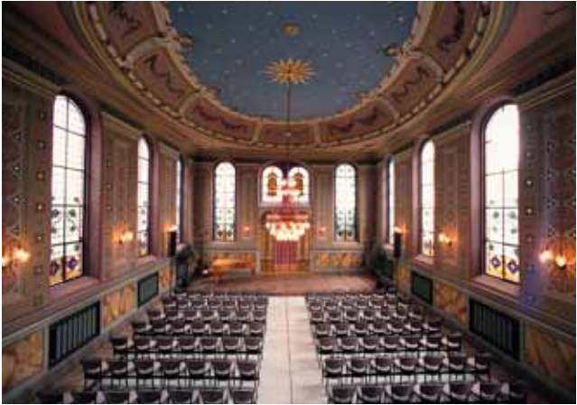
Stadt Ichenhausen, Ehemalige Synagoge Ichenhausen